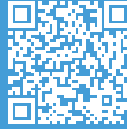
Legrand Ansprechpartner AT